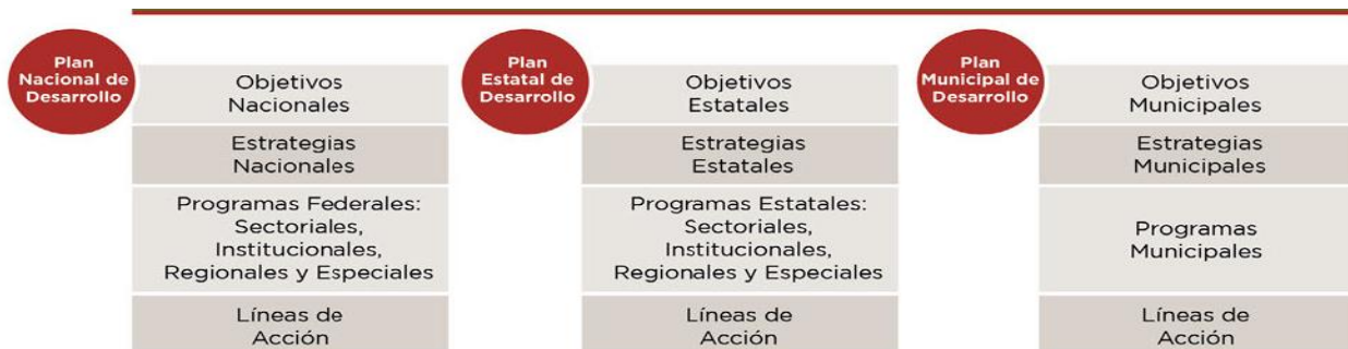
Figura 1. Alineación de la Planeación entre los tres órdenes de gobierno Fuente: INAFED 2019 y PMD 2018-2021

Con relación al Plan Municipal de Desarrollo 2018-2021 se encuentra alineado al Plan Nacional de Desarrollo 2019-2024 (PND) y al Plan Estatal de Desarrollo 2019-2024 (PLED), de acuerdo con la revisión al PMD 2018-2021 se encontró que para su elaboración se contó con el acompañamiento de entes asignados para formulación como son el COPLADET y COPLADEMUN, la vinculación de los Ejes Rectores y Transversales del PMD 2018-2021 con los del PLED y el PND, se estableció considerando las facultades, las dinámicas y las necesidades singulares del municipio, ver figura 1.