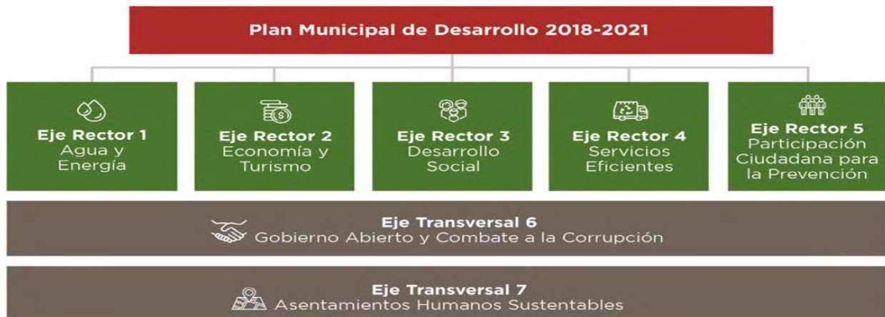
Figura 2. Estructura del Plan Municipal de Desarrollo 2018-2021 Fuente. PMD 2018-2021